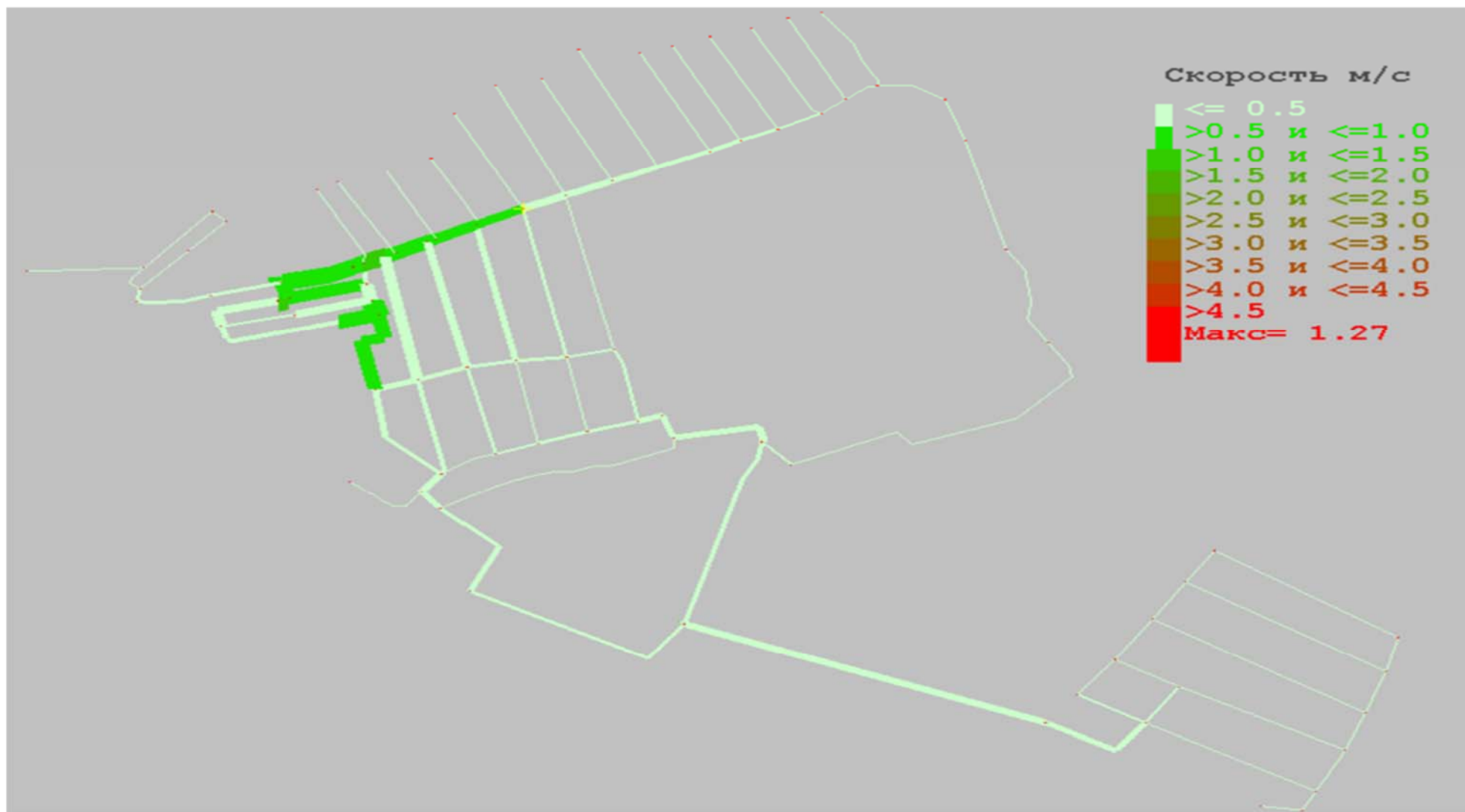
Рисунок 2.4 - Карта скоростей перспективной сети водоснабжения д. Карлук