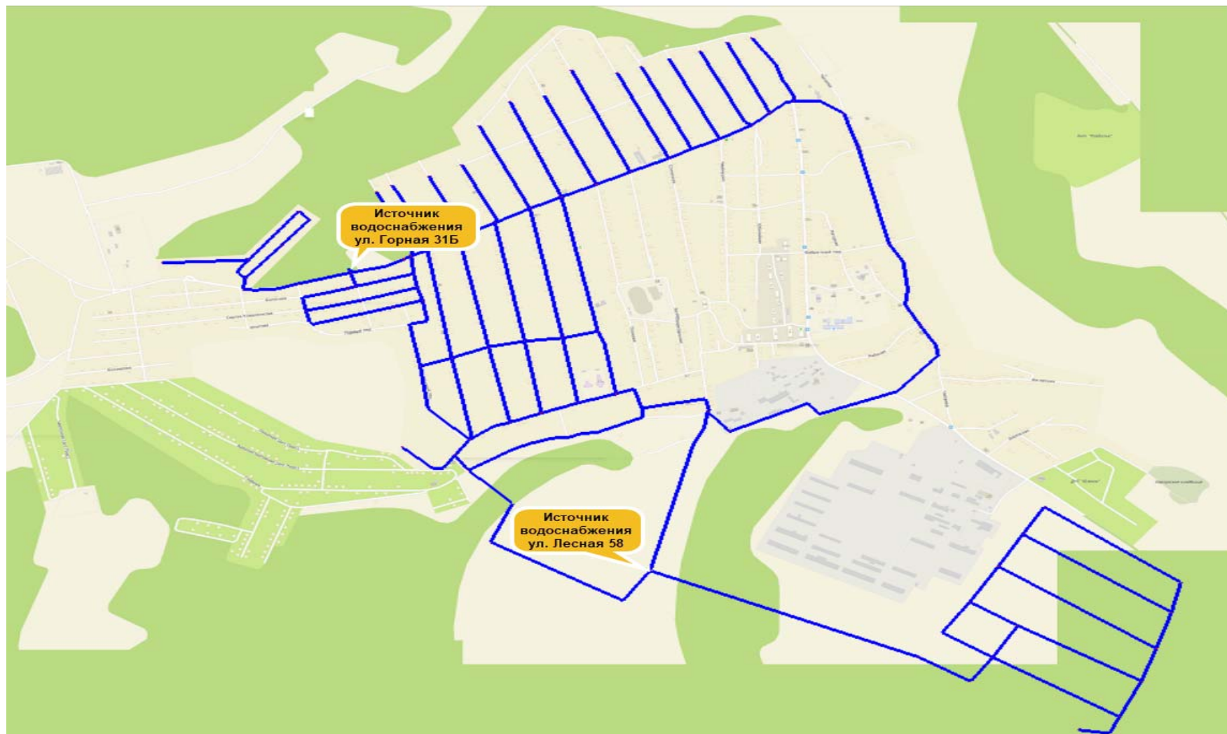
Рисунок 2.1 - Схема перспективных сетей водоснабжения д. Карлук