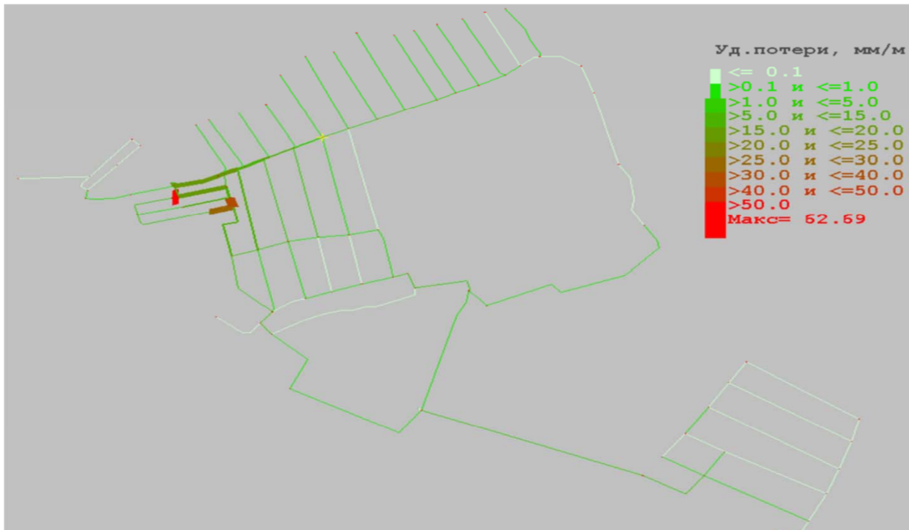
Рисунок 2.5 - Карта потерь перспективной сети водоснабжения д. Карлук