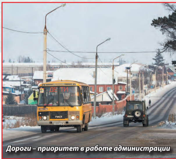
Дороги – приоритет в работе администрации