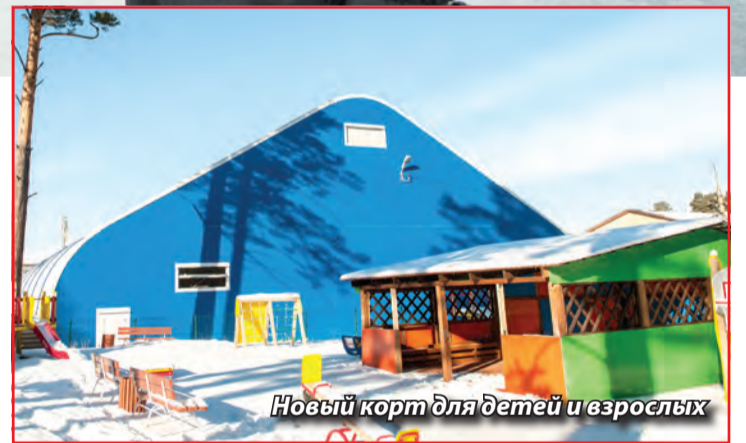
Новый корт для детей и взрослых