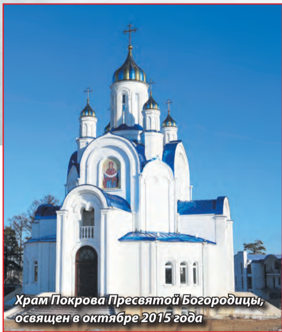
Храм Покрова Пресвятой Богородицы, освящен в октябре 2015 года