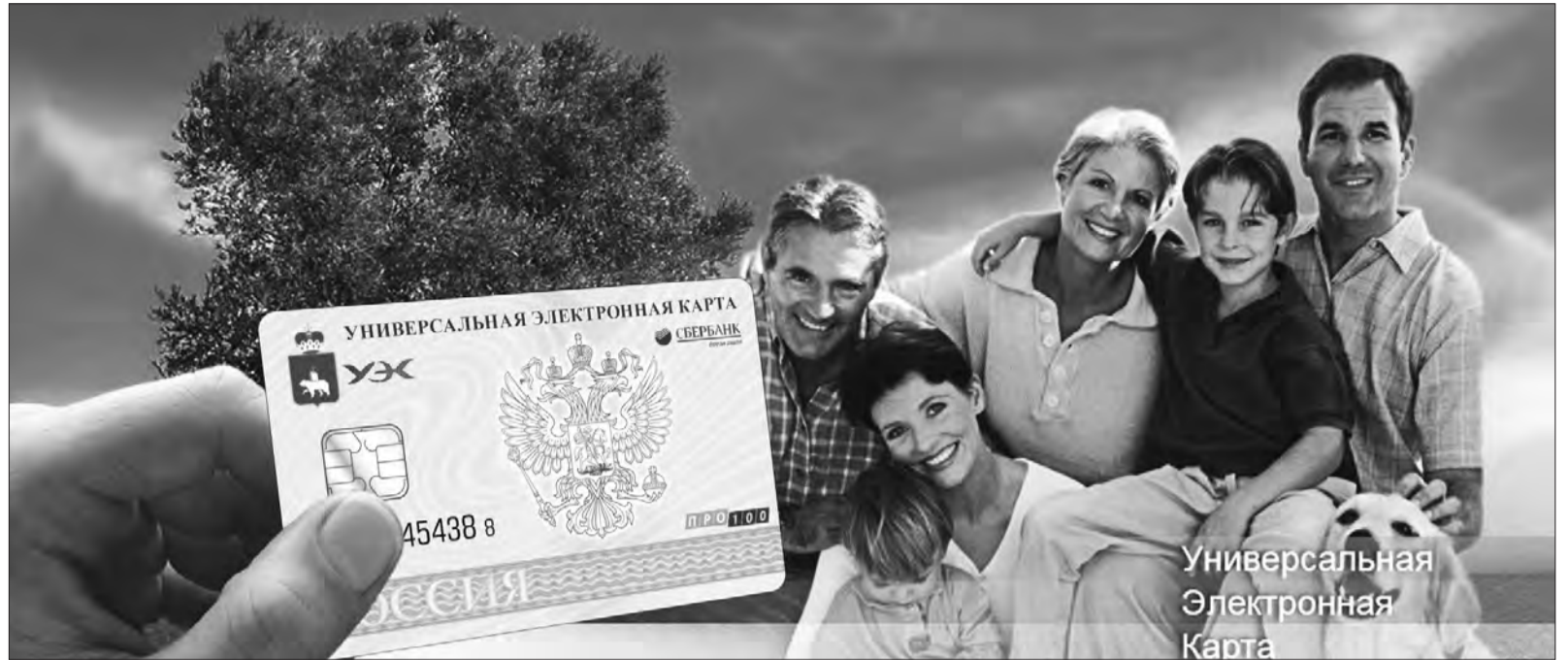
Универсальная Электронная Карта

УЭК безопасна, так как она не содержит в себе базу данных граждан. Все сведения находясь в электронных хранилищах государственных министерств и ведомств, и только эти организации имеют доступ к записям. Карта лишь помогает быстрее найти нужные данные. Поэтому утеря или кража карты не приведет к утрате гражданином персональных сведений о себе. Кроме того, чтобы приме-