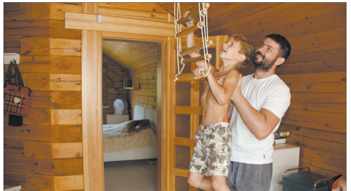
Материалы полосы подготовила Ирина Галанова