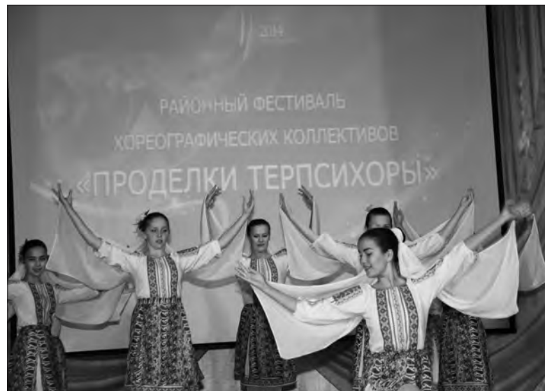
Материалы полосы подготовила Ирина Галанова