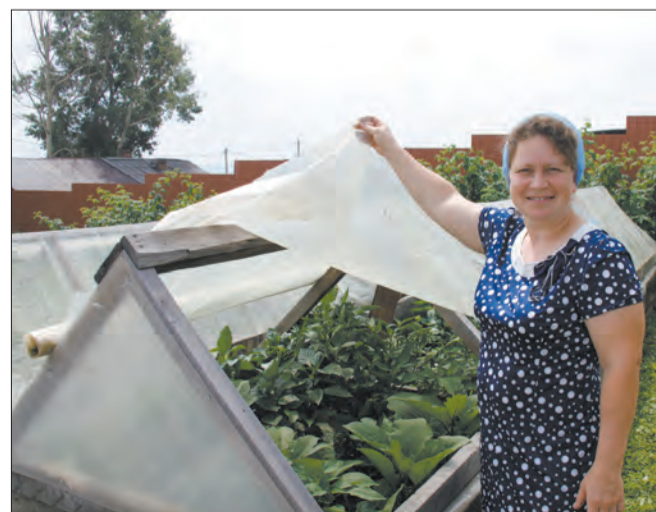
Материалы полосы подготовила Ирина Галанова

В доме Парфеновых всегда рады гостям, у ребятшек много друзей. В их добрых сердцах всем добрым людям найдется место и любовь.