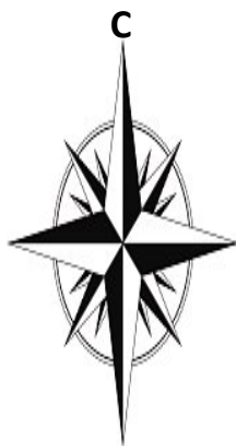
СХЕМА ГРАНИЦ С ОСОБЫМИ УСЛОВИЯМИ ИСПОЛЬЗОВАНИЯ ТЕРРИТОРИИ М 1:2000