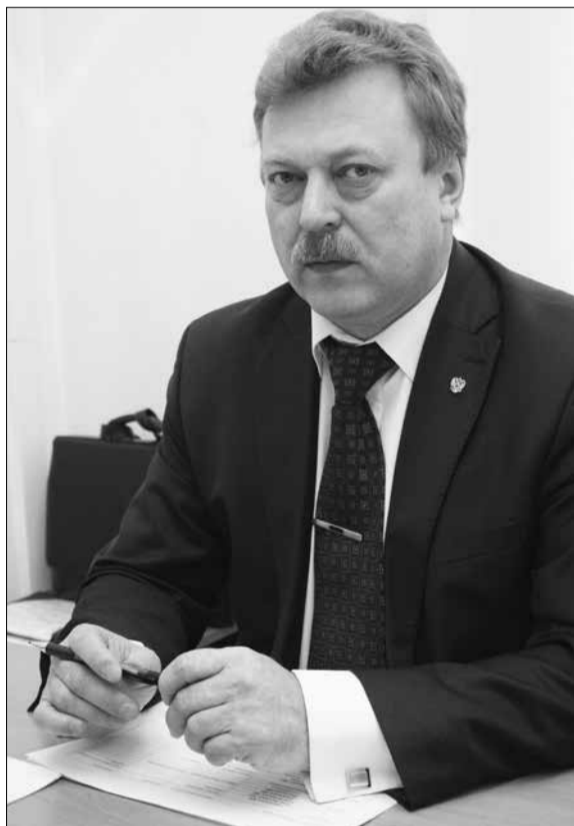
по управлению имуществом вот уже два месяца работает в авральном режиме. Поясните, пожалуйста, происходящие перемены.

— В связи с изменениями в российском законодательстве о земле, районный комитет