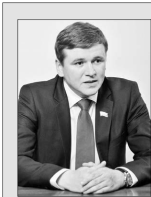
подрядные организации и ведутся работы. Жители должны знать, за что они платят свои деньги».

– Фонд будет заключать договоры с собственниками помещений; организовывать начисление, сбор и учёт взносов на капитальный ремонт общего имущества в многоквартирных домах, подлежащих зачислению в фонд капитального ремонта, и осуществлять контроль за целевым использованием финансовых средств, перечисляемых со счетов Фонда. Он будет осуществлять функции технического заказчика работ и финансировать расходы на