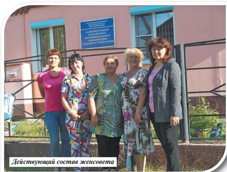
Действующий состав женсовета