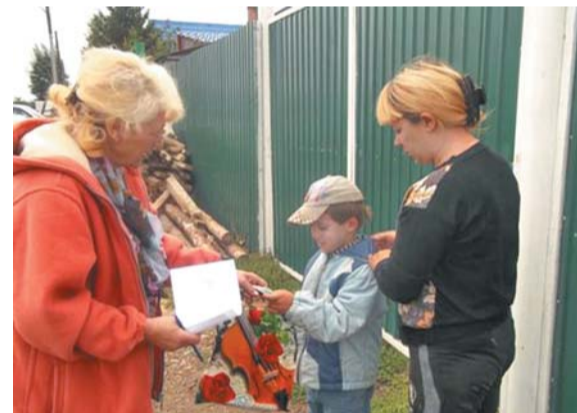
Операция «ШКОЛЬНЫЙ ПОРТФЕЛЬ»

Большая работа была проведена в подготовке 70-летия Победы. Совместно с Советом ветеранов приняли участие в подготовке портретов фронтовиков для шествия на параде «Бессмертный полк»