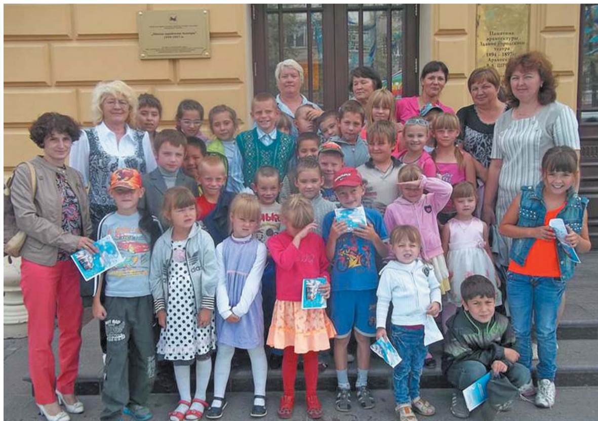
Взаимодействие с районным женсоветом. Поездка детей из малообеспеченных семей в театр Охлопкова