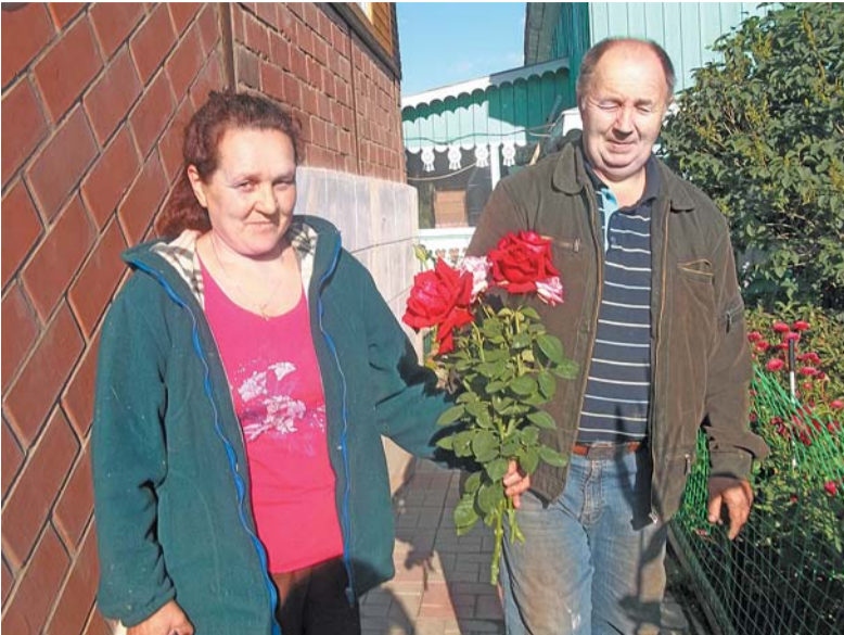
лучшее ветеранское подворье

В этом году мы у себя организовали группу здоровья и 12 пенсионерок в возрасте от 60 до 80 лет регулярно занимаются скандинавской ходь-