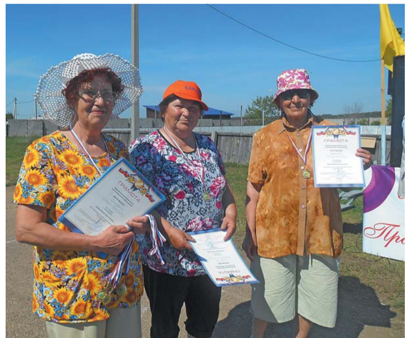
5-е карлукские игры

Участие в районной спартакиаде пенсионеров.