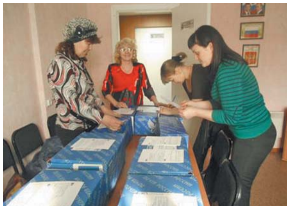
Ежегодная акция «Посылка в армию»